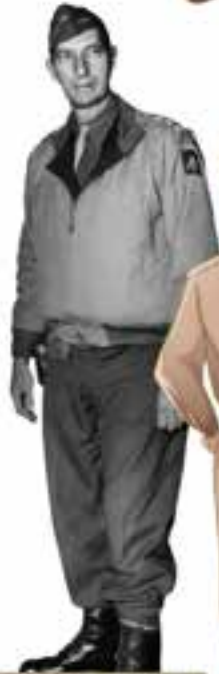
Mark Wayne Clark